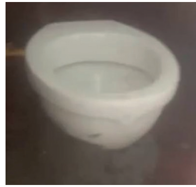
Uno dei due vasi installati!!